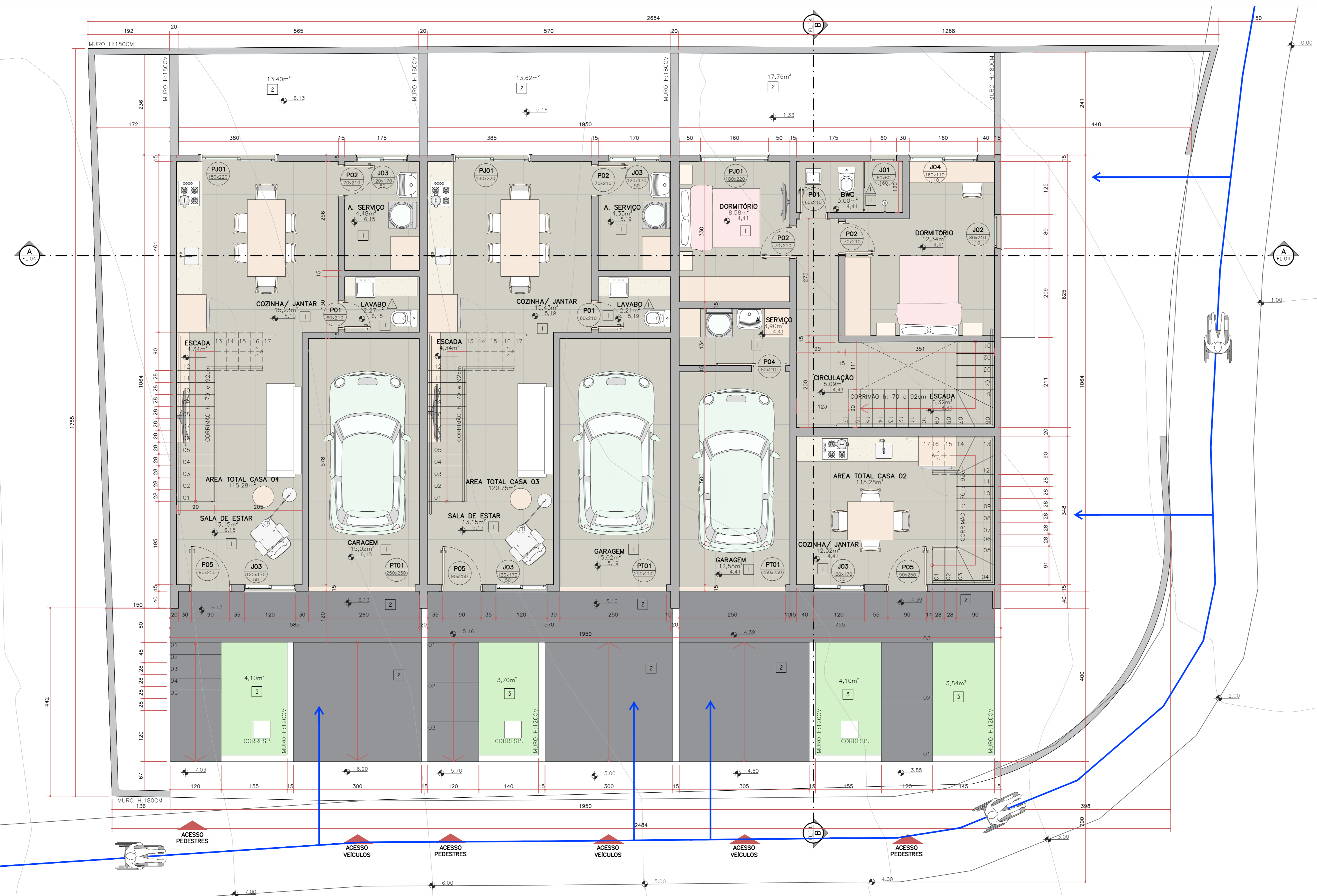
PLANTA PAV. 2 ESC. 1:50